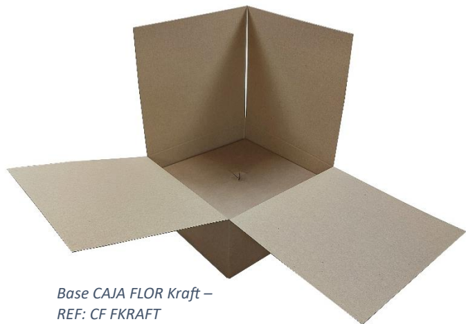
Base CAJA FLOR Kraft – REF: CF FKRAFT