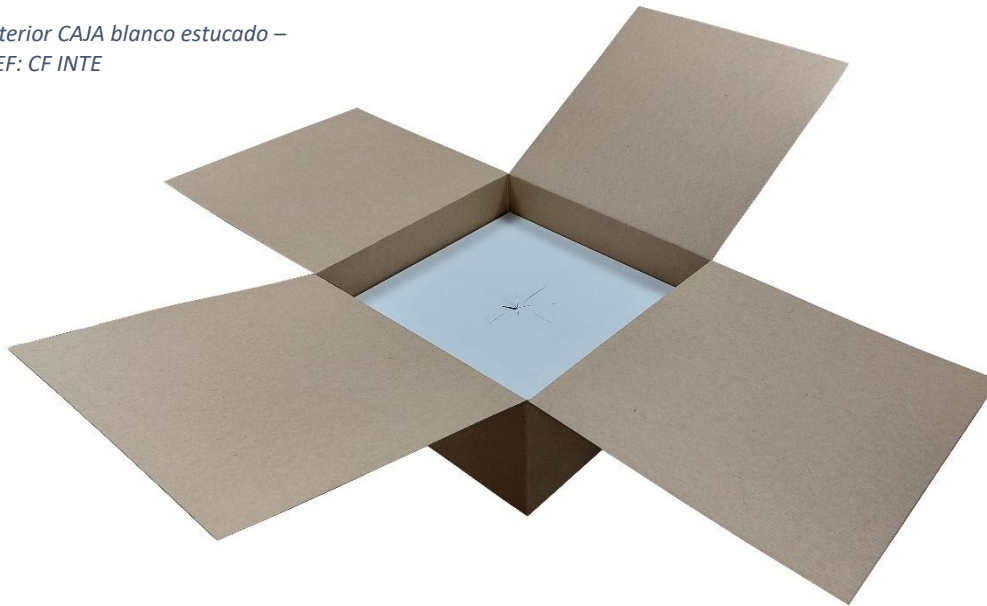
Interior CAJA blanco estucado – REF: CF INTE