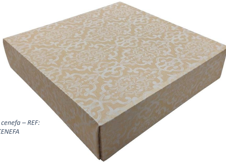
TAPA cenefa – REF: CF TCENEFA