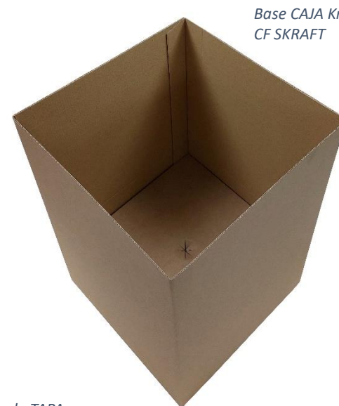
Base CAJA Kraft – REF: CF SKRAFT