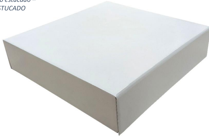
TAPA blanco estucado – REF: CF TESTUCADO