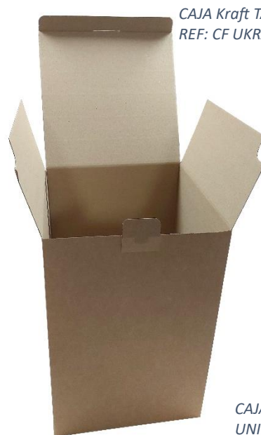
CAJA Kraft TAPA UNIDA – REF: CF UKRAFT