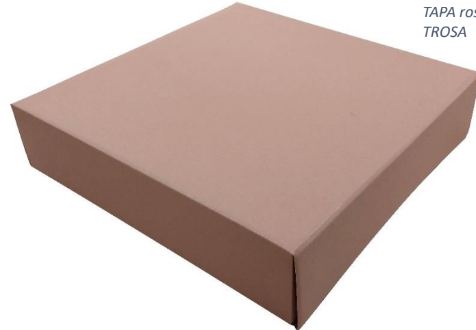
TAPA rosa – REF: CF TROSA