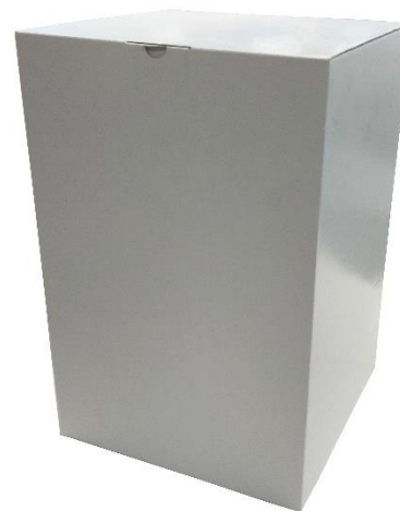
CAJA blanco estucado TAPA UNIDA – REF: CF UESTUCADO